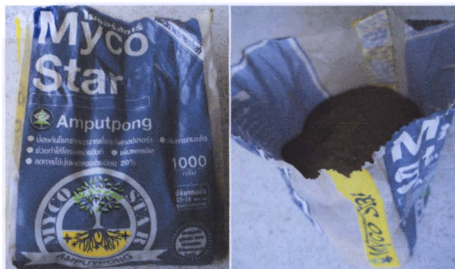
ภาพที่ 3 เชื้อราอาร์บัสคูลามายคอร์ไรซาที่มีจำหน่ายในท้องตลาด ใช้ชื่อทางการค้าคือ MycoStar®

การเพิ่มปริมาณสปอร์ของเชื้อราเอนโดไมคอร์ไรซาในพืชอาศัยให้เหมาะสมกับชนิดของเชื้อรา เอนโดไมคอร์ไรซา ในการทดลองนี้วางแผนการทดลองแบบ Randomize Complete Block Design (RCB) โดยใช้พืชอาศัย 5 ชนิด คือ ข้าว ข้าวฟ่าง ข้าวโพด ลูกเดือย และดาวเรืองฝรั่งเศส ปลูกร่วมกับ เชื้อราเอนโดไมคอร์ไรซา 4 ชนิด ได้แก่ Acaulospora tuberculata AMF05 จากต้นสบูดำ, Scutellospora sp. และ Acaulospora sp. จากพืชไร่บนที่สูงในหมู่บ้านทิมะ จ. แม่ฮ่องสอน, Glomus etunicatum จากพืชท้องถิ่นที่ใช้ในการปลูกป่า และเชื้อราเอนโดไมคอร์ไรซา Piriformospora indica จาก Prof. Dr. R.J. Strasser, Laboratory of Bioenergetics and Microbiology, Department of Botany and Plant Biology, University of Geneva, Switzerland ทำการทดลองกรรมวิธีละ 3 ซ้ำ โดยปลูกเชื้อจำนวน 100 สปอร์ หรือ เส้นใย 5 g (กรณี P. indica เนื่องจากเป็นเชื้อราแบบเส้นสายและสามารถเพาะเลี้ยงได้ในอาหาร PDB) กับต้นกล้าของพืชอาศัยแต่ละชนิด ในกระถางขนาดเส้นผ่าศูนย์กลาง 8 นิ้ว ที่บรรจุดิน:ทราย 2 kg ในอัตราส่วน 1:1 และรดด้วยสารละลายธาตุอาหารสูตรคัดแปลงของ Hoagland สัปดาห์ละ 1 ครั้ง เป็นระยะเวลา 4 เดือน ยกเว้นดาวเรืองฝรั่งเศสทำการทดลองเป็นเวลา 2 เดือน โดยงดการให้น้ำ 1 สัปดาห์ก่อนเก็บเกี่ยว แล้วเก็บเกี่ยวรากและดิน บันทึกจำนวนสปอร์ในดิน และเปอร์เซ็นต์การเข้าสู่ราก