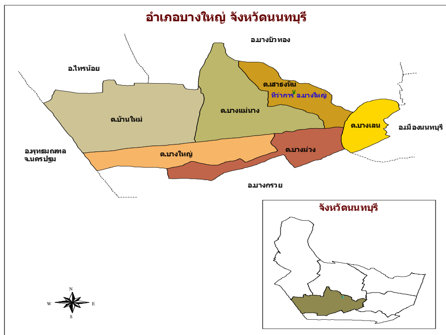
ภาพที่ 3.1 แผนที่อำเภอบางใหญ่

ข้อมูลหน่วยบริการภาครัฐ อำเภอบางใหญ่มีหน่วยงานให้บริการภาครัฐหลายแห่ง ได้แก่