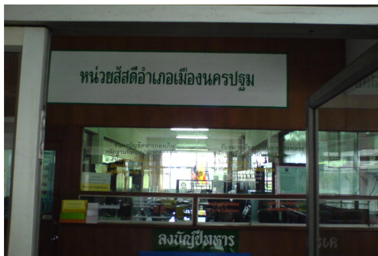
ภาพที่ 3.14 การให้บริการของสำนักงานพัฒนาชุมชนอำเภอเมืองนครปฐม