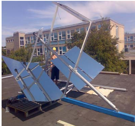
ภาพที่ 2.19 Parabolic Reflector