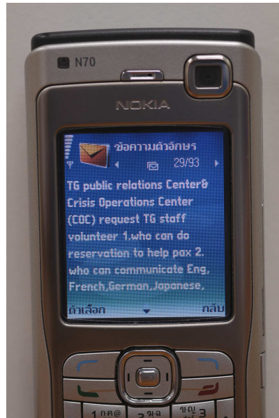
ตัวอย่างข้อความ SMS TG NES