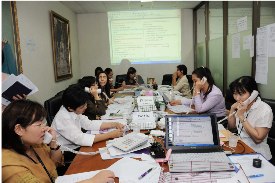
ศูนย์ประชาสัมพันธ์ชั่วคราว หรือศูนย์ 4P 4000