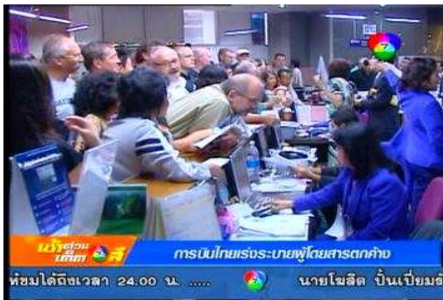
ข่าวลักษณะตัววิ่งทางสื่อโทรทัศน์