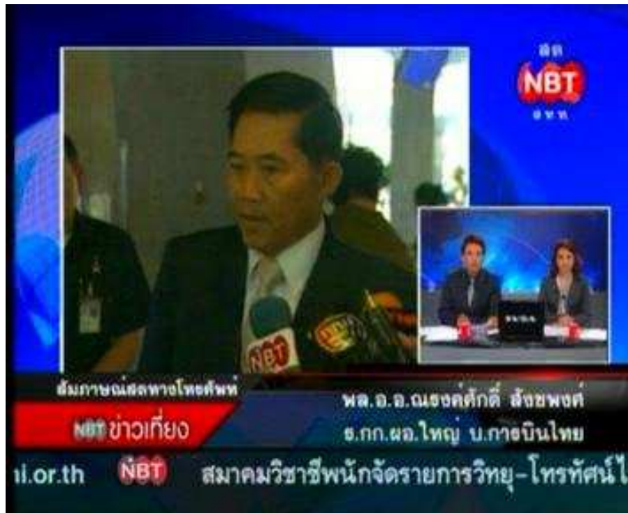
การสัมภาษณ์สดทางโทรศัพท์ หรือ โฟนอิน