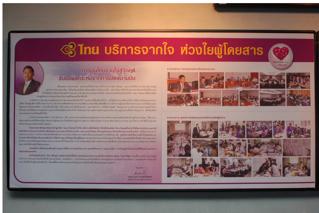
บอร์ดประชาสัมพันธ์ประมวลภาพการปฏิบัติงานของพนักงาน