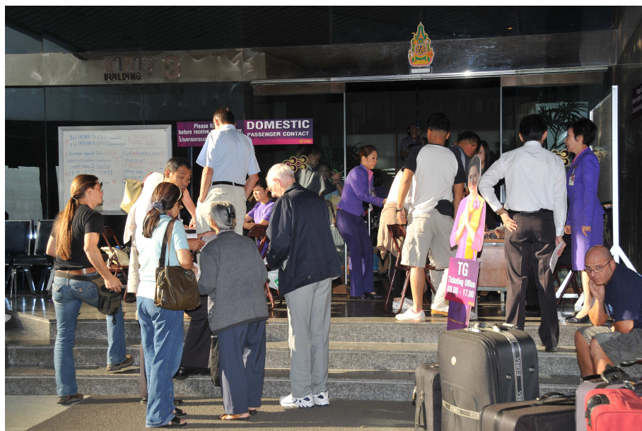
การต้อนรับ ดูแล และอำนวยความสะดวกแก่ผู้โดยสาร ที่บริษัท การบินไทย จำกัด (มหาชน) สำนักงานใหญ่