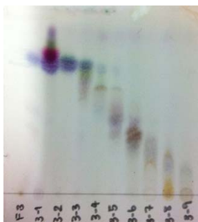
รูปที่ 3 แสดงการเคลื่อนที่ของสารใน fraction F3-1 – F3-9 บนแผ่น TLC

นำส่วนสกัด F3 มาแยกเป็นส่วนย่อยๆ โดยการผ่าน flash column chromatography โดยใช้ silica gel 60 เป็นตัวดูดซับ และชะด้วยตัวทำละลาย hexane/EtOAc 1 : 1 ได้ส่วนสกัดย่อย F3-1 ถึง F3-9 พร้อมกันนี้ได้ทดสอบฤทธิ์ในการยับยั้งเอนไซม์แพนครีเอติกไลเปส (%inhibition) ซึ่งแสดงในตารางที่ 3 โดยที่หากส่วนสกัดย่อย (subfraction) ที่ได้มีน้ำหนักน้อยกว่า 100 มิลลิกรัม จะยังไม่พิจารณานำไปตรวจสอบฤทธิ์ทางชีวภาพ แต่ส่วนสกัดย่อยทั้งหมดได้ถูกตรวจสอบโดย TLC ดังแสดงในรูปที่ 3