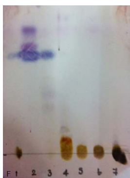
รูปที่ 2 แสดงการเคลื่อนที่ของสารใน fraction F1 – F7 บนแผ่น TLC

จากการนำ fraction ของ EtOAc extract ทั้งหมด (F2-F7) ไปทดสอบฤทธิ์การยับยั้งเอนไซม์ แพนครีเอติกไลเปส พบว่า มีร้อยละของการยับยั้งเอนไซม์ (%inhibition) เป็นดังตารางที่ 2 และได้เลือก fraction หรือส่วนสกัด ที่มีร้อยละของการยับยั้งเอนไซม์ที่สูงเพียงพอ (มากกว่า 70%) มีปริมาณเหมาะสม และมีความเป็นไปได้สูงในการทำการแยกต่อไป คือ F3 เพื่อนำมาแยกสารสำคัญที่มีฤทธิ์ทางชีวภาพนี้ โดยรูปแบบการเคลื่อนที่ของสารบน TLC จากแต่ละ fraction แสดงในรูปที่ 2