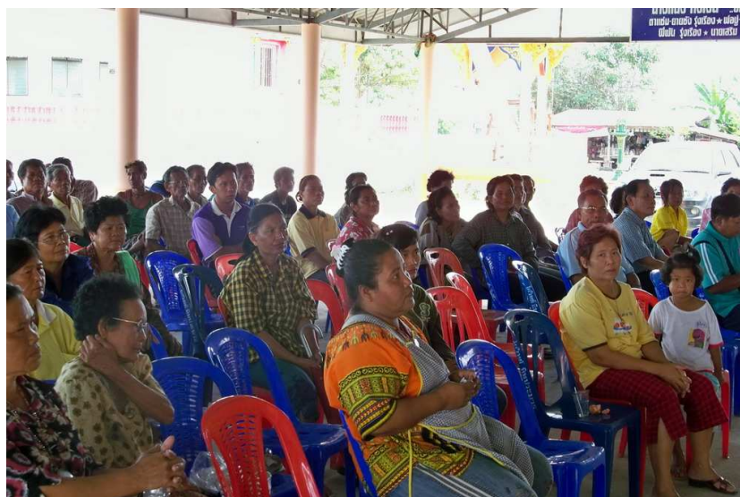
เวทีชุมชน/ประชุมประชาคมรายหมู่บ้าน ตำบลบางลูกเสือ