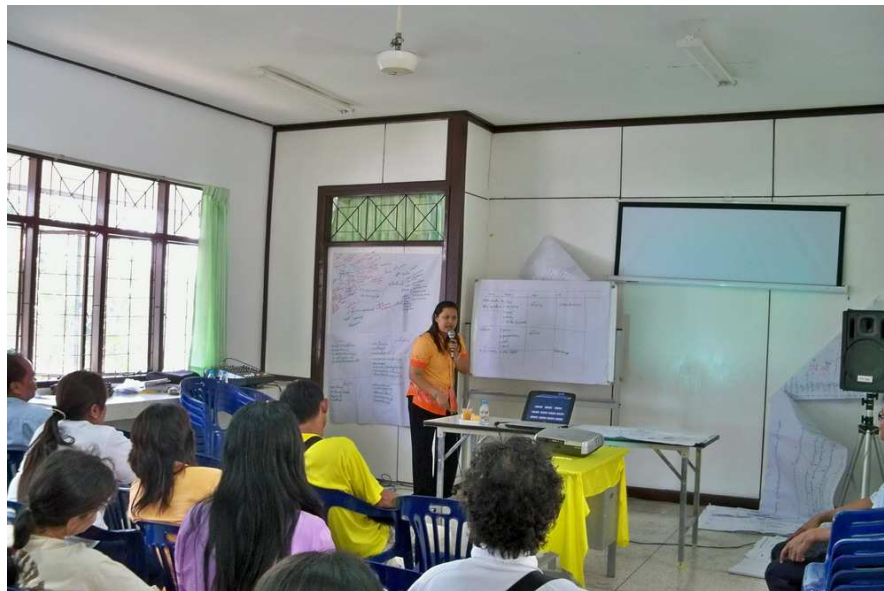
จัดทำแผนงาน/โครงการส่งเสริมสุขภาพ ป้องกันโรคและฟื้นฟูสุขภาพ ตำบลบางลูกเสือ