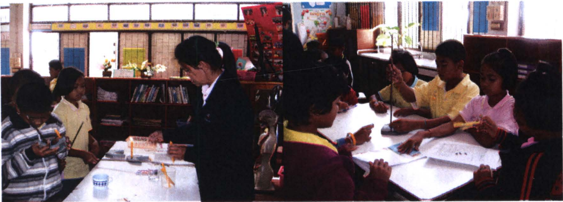
ภาพที่ 4.3 สภาพบริบทจริงในการจัดการเรียนการสอนของครูผู้สอนโรงเรียนที่ 3

จากการศึกษาบริบทของโรงเรียนที่ 3 จะเห็นได้ว่าการจัดการเรียนการสอนยังมุ่งเน้นการบรรยาย ถ่ายทอดสารสนเทศและความรู้ของครู มีการทดลองบ้าง แต่บางครั้งยังมีลักษณะเป็นการอธิบายโดยครูผู้สอน แต่ไม่ได้ทำปฏิบัติการทดลองจริง การศึกษาในแหล่งการเรียนรู้ภายในโรงเรียนและในชุมชน รวมทั้งการใช้ภูมิปัญญาท้องถิ่น เชิญภูมิปัญญามาเล่าประสบการณ์ และถ่ายทอดองค์ความรู้