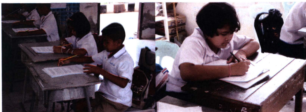
ภาพที่ 4.5 สภาพบริบทจริงในการจัดการเรียนการสอนของครูผู้สอนโรงเรียนที่ 5

จากการศึกษาบริบทของโรงเรียนที่ 5 จะเห็นได้ว่าการจัดการเรียนการสอนยังมุ่งเน้น การบรรยาย ถ่ายทอดหรือบอกสารสนเทศและความรู้ของครู รวมทั้งให้ปฏิบัติตามใบงาน ที่มอบหมาย อาจมีการทดลอง แต่ส่วนใหญ่ยังมีลักษณะเป็นการอธิบายโดยครูผู้สอน ผู้เรียน ยังไม่ได้ปฏิบัติการทดลองจริง การศึกษาในแหล่งการเรียนรู้ภายในโรงเรียนและในชุมชน