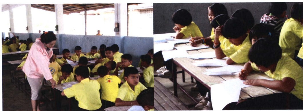
ภาพที่ 4.4 สภาพบริบทจริงในการจัดการเรียนการสอนของครูผู้สอนโรงเรียนที่ 4

จากการศึกษาบริบทของโรงเรียนที่ 4 จะเห็นได้ว่าการจัดการเรียนการสอนยังมุ่งเน้นการบรรยาย ถ่ายทอดหรือบอกสารสนเทศและความรู้ของครู รวมทั้งให้ปฏิบัติตามใบงานที่มอบหมาย อาจมีการทดลอง แต่ส่วนใหญ่ยังมีลักษณะเป็นการอธิบายโดยครูผู้สอน ผู้เรียนยังไม่ได้ปฏิบัติการทดลองจริง การศึกษาในแหล่งการเรียนรู้ภายในโรงเรียนและในชุมชน รวมทั้งการใช้ภูมิปัญญาท้องถิ่น ยังเป็นวิธีการเชิงภูมิปัญญามาแล้วประสบการณ์ และถ่ายทอดองค์ความรู้