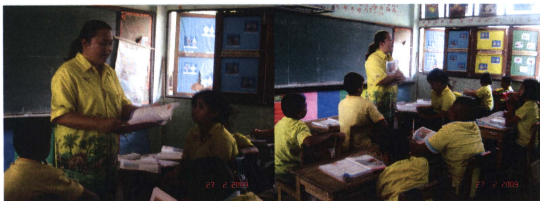
ภาพที่ 4.2 สภาพบริบทจริงในการจัดการเรียนการสอนของครูผู้สอนโรงเรียนที่ 2

การเรียนรู้ภายในโรงเรียนและในชุมชน แต่ยังไม่มีการส่งเสริมให้ผู้เรียนเกี่ยวกับหลักปรัชญาเศรษฐกิจพอเพียงในการบูรณาการการเรียนรู้ รวมทั้ง คุณธรรมและค่านิยมไทย จากการสังเกตการจัดการเรียนการสอน พบว่า ผู้เรียนตอบคำถามโดยการคัดลอกจากหนังสือแบบเรียนและใบความรู้ ผู้เรียนและครูมีปฏิสัมพันธ์ในระดับต่ำ โดยครูมีบทบาท เช่น แจกใบงานและถามคำถามให้เขียนตอบและกระตุ้นให้อ่าน และเน้นย้ำว่า ให้ผู้เรียนอ่านหนังสือเรียนเพราะในหนังสือมีคำตอบอยู่แล้ว ในการจัดกลุ่มของครูพบว่านักเรียน ขาดความได้ร่วมมือกันในการเรียนรู้ ส่วนใหญ่จะนั่งเงียบ สนทนาเรื่องอื่น ๆ นอกเหนือจากเรื่องที่กำลังเรียน และเฝ้าดูเพื่อนที่เป็นตัวแทนเขียนตอบคำถาม จากการสังเกต พบว่านักเรียนส่วนใหญ่ ขาดความกระตือรือร้นในการทำกิจกรรมในการเรียน ทั้งอ่าน บางส่วนนั่งเฉย ๆ และสนทนาหรือคุยกัน ไม่ให้สนใจเรื่องของเวลาที่ครูกำหนด และเมื่อถึงเวลาส่ง นักเรียนจะรีบเขียนคำตอบตามหนังสืออย่างเร่งรีบและจากการสัมภาษณ์ครูเกี่ยวกับภูมิปัญญาที่นำมาใช้ในการเรียนการสอนพบว่า ครูได้นำเรื่องสมุนไพร ที่ได้ฟังจากชาวบ้านที่เป็นคนแก่เล่าให้ฟัง แล้วสืบค้นเพิ่มเติมในอินเทอร์เน็ต นำมาสรุปเป็นองค์ความรู้ เพื่อใช้สอนนักเรียน