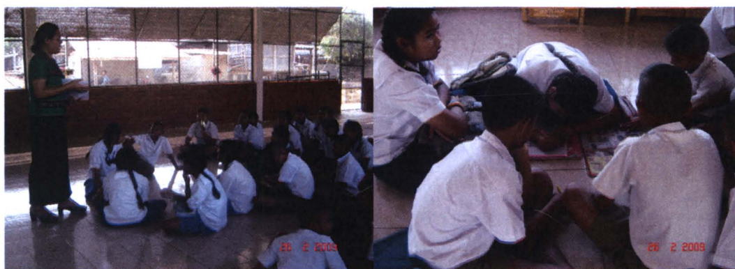
ภาพที่ 4.1 แสดงสภาพบริบทจริงในการจัดการเรียนการสอนของครูผู้สอนโรงเรียนที่ 1

จากการศึกษาบริบทของโรงเรียนที่ 1 โดยรวมจะเห็นได้ว่าการจัดการเรียนการสอนยังมุ่งเน้น การบรรยาย ถ่ายทอดสารสนเทศและความรู้ของครู อาจมีการทดลอง การศึกษาในแหล่งการเรียนรู้ภายในโรงเรียนและในชุมชน รวมทั้งการใช้ภูมิปัญญาท้องถิ่น ยังเป็นวิธีการเชิงภูมิปัญญามาแล้วประสบการณ์ และถ่ายทอดองค์ความรู้ โดยเฉพาะอย่างยิ่งทางด้านดนตรีพื้นเมือง แต่ยังไม่พบที่มีการจัดการเรียนการสอนที่ส่งเสริมหรือสอดแทรกเกี่ยวกับเศรษฐกิจพอเพียง ได้แก่ 1) การพอประมาณ 2)การมีเหตุผล และ 3) การสร้างภูมิคุ้มกัน โดยอาศัยเงื่อนไขความรู้และเงื่อนไขคุณธรรม รวมทั้งการส่งเสริมคุณธรรมพื้นฐาน 8 ประการ ได้แก่ 1) ชยัน 2) ประหยัด 3) ความซื่อสัตย์ 4) มีวินัย 5) สุภาพ 6) สะอาด 7) สามัคคี และ 8) มีน้ำใจ และการส่งเสริมการสร้างค่านิยมไทยพื้นฐาน 5 ประการ ได้แก่ 1) การพึ่งตนเอง ชยันหมั่นเพียร และมีความรับผิดชอบ 2) การประหยัดและออม 3) การมีระเบียบวินัยและเคารพกฎหมาย การรู้จักประพฤติปฏิบัติตามระเบียบแบบแผนและขนบธรรมเนียมประเพณีอันดีงาม 4) การปฏิบัติตามคุณธรรมของศาสนา และ 5) ความรักชาติ ศาสน์ กษัตริย์ นอกจากนี้ ปรากฏว่า ได้มีการจัดการเรียนการสอนที่ส่งเสริมหรือสอดแทรกเกี่ยวกับเศรษฐกิจพอเพียงบ้าง ในการสอนตามหัวข้อที่ตรงกับเรื่องเศรษฐกิจพอเพียง รวมทั้งการสอดแทรกหรือส่งเสริมความรู้เกี่ยวกับคุณธรรมพื้นฐานและค่านิยมไทย