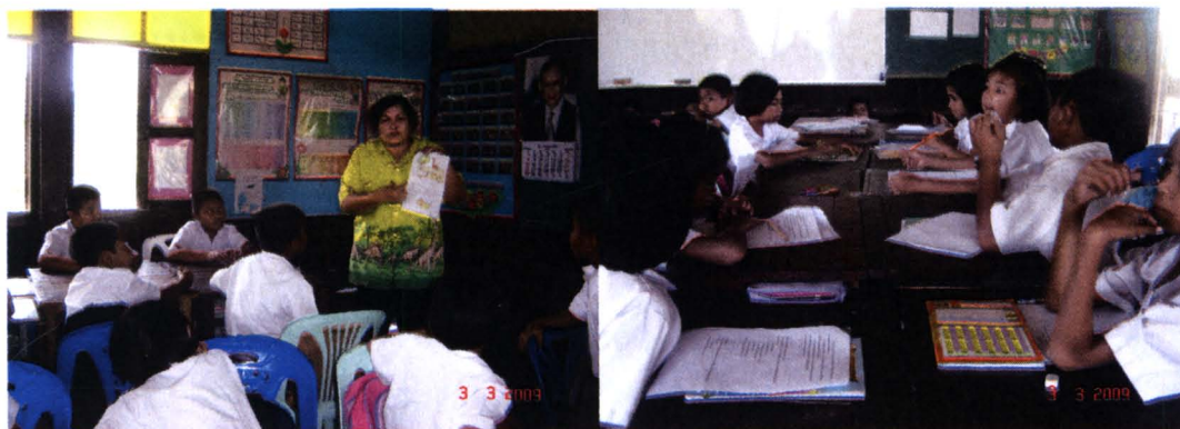
ภาพที่ 4.8 สภาพบริบทจริงในการจัดการเรียนการสอนของครูผู้สอนโรงเรียนที่ 8

ประกอบด้วย ห้องคอมพิวเตอร์ 1 ห้องมีประมาณ 35 เครื่อง มีการเชื่อมโยงเครือข่ายอินเทอร์เน็ต ซึ่งผู้เรียนสามารถเข้าไปสืบค้นได้