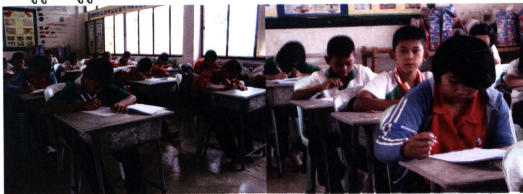
ภาพที่ 4.7 สภาพบริบทจริงในการจัดการเรียนการสอนของครูผู้สอนโรงเรียนที่ 7

ผลจากการศึกษาบริบทของโรงเรียนที่ 7 ปรากฏว่า การจัดการเรียนการสอนยัง มุ่งเน้นการบรรยาย ถ่ายทอดหรือบอกสารสนเทศและความรู้ของครู รวมทั้งให้ปฏิบัติตาม แบบฝึกหัดในหนังสือ อาจมีการทดลองซึ่งในการทดลองให้ผู้เรียนเองปฏิบัติตามหนังสือ แบบเรียน หรือเป็นการให้ทำการทดลองแล้วเติมผลในแบบฝึก โดยอาศัยข้อมูลในหนังสือเรียน สำหรับการทดลอง พบว่า อุปกรณ์ต่าง ๆ ก็ไม่พร้อมและเหมาะสมกับการเรียนรู้ การศึกษาใน แหล่งการเรียนรู้ภายในโรงเรียนและในชุมชน รวมทั้งการใช้ภูมิปัญญาท้องถิ่น ยังเป็นวิธีการบอก เล่าจากครูผู้สอนสู่ผู้เรียน