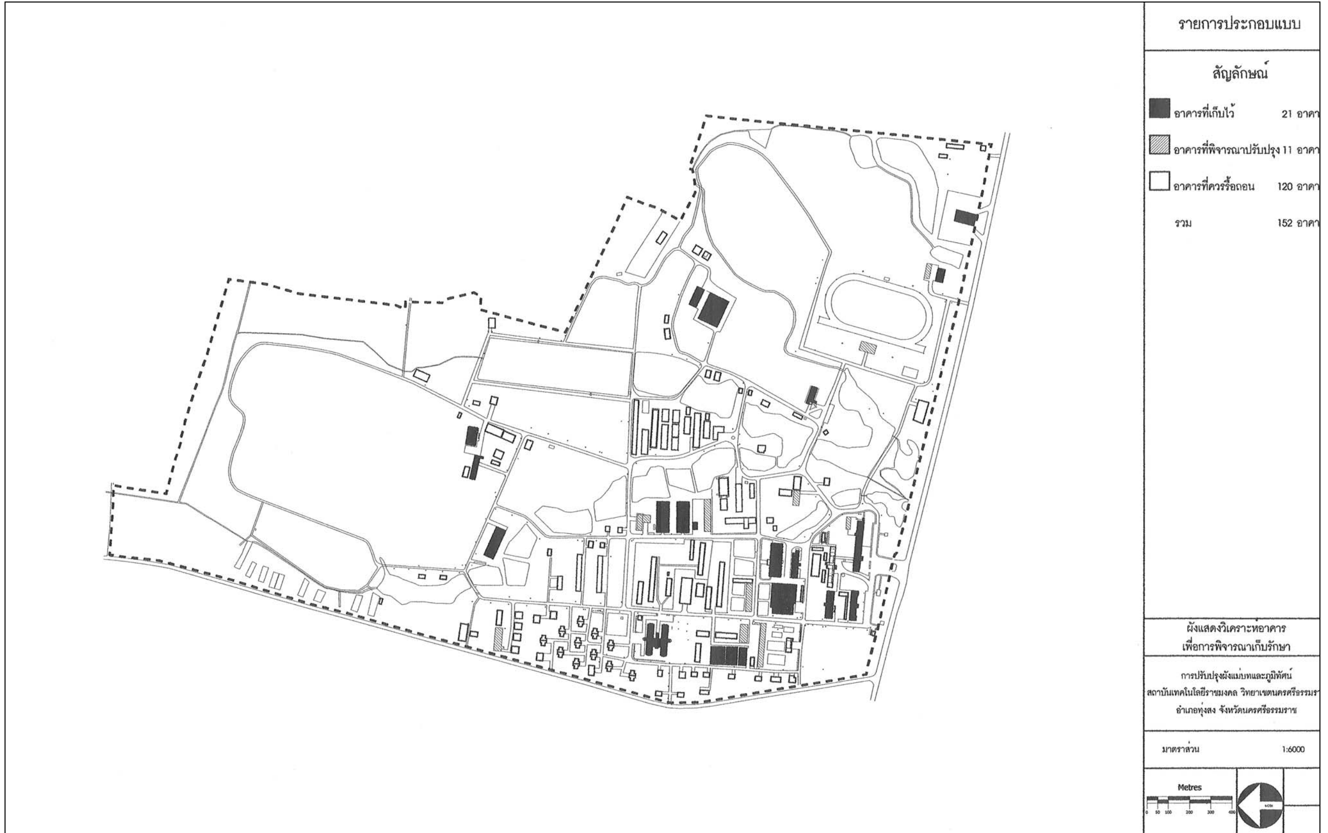
ภาพที่ 48 ผังแสดงวิเคราะห์อาคารเพื่อการพิจารณาเก็บรักษา