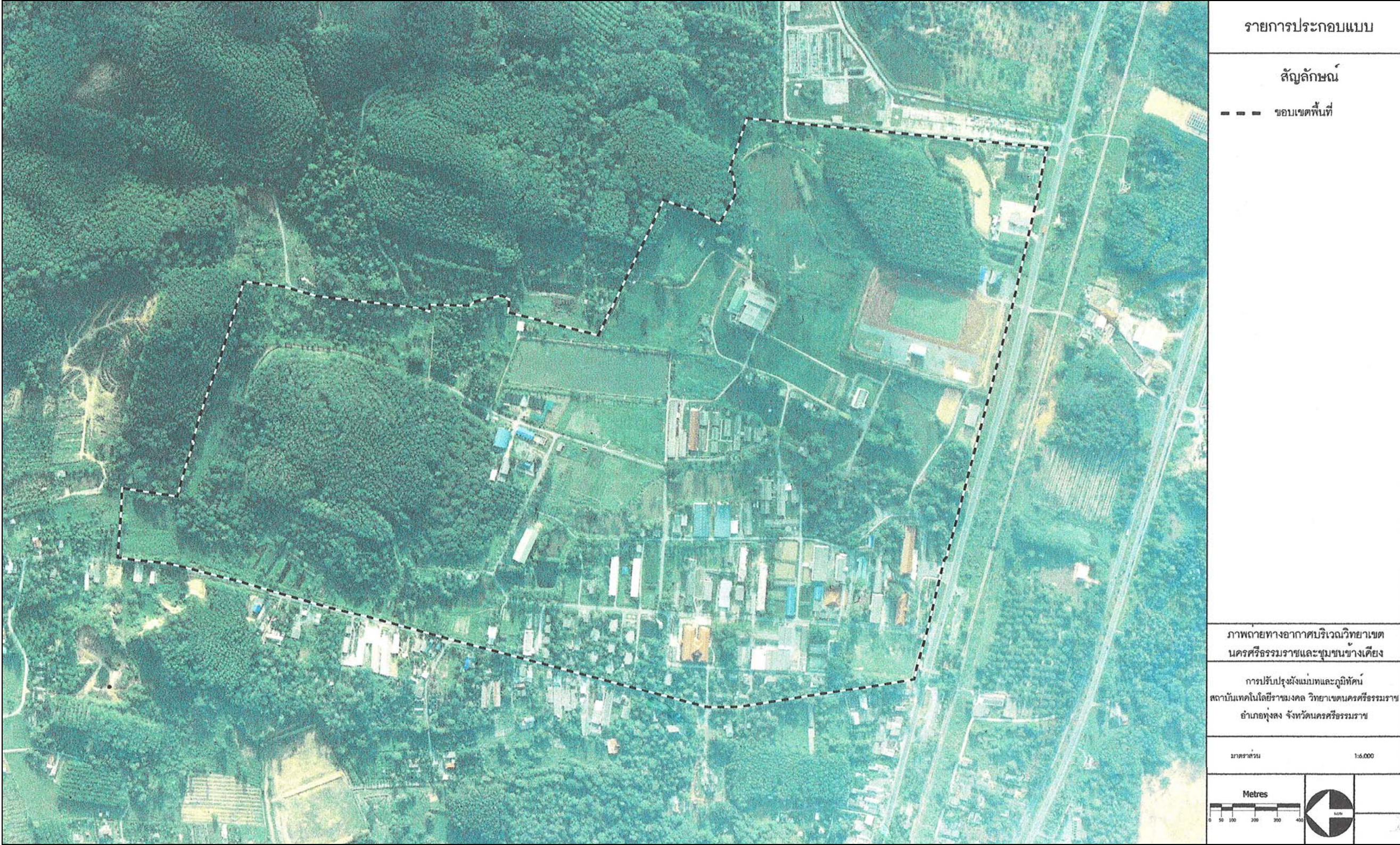
ภาพที่ 10 ภาพถ่ายทางอากาศบริเวณวิทยาเขตนครศรีธรรมราชและชุมชนข้างเคียง ที่มา: กรมแผนที่ทหาร พ.ศ. 2546