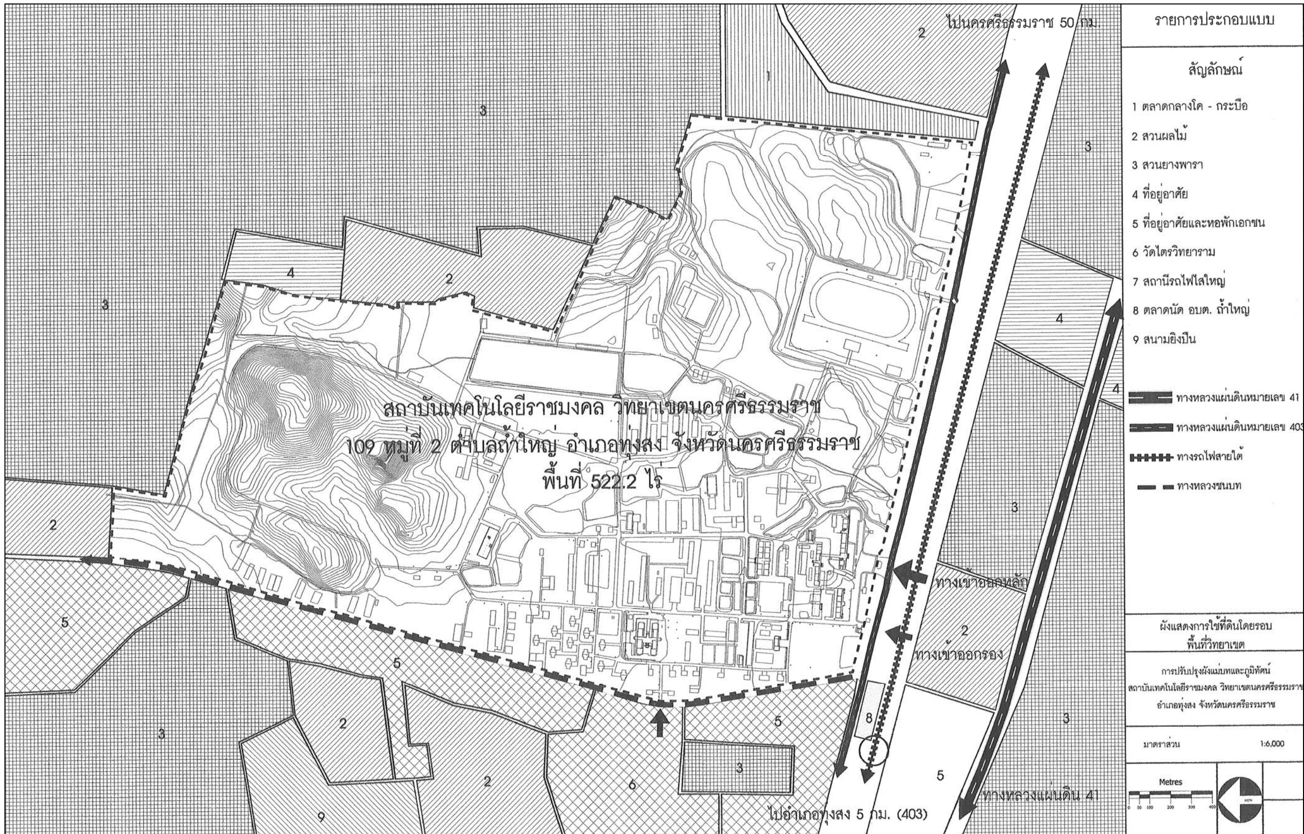
ภาพที่ 13 ผังแสดงการใช้ที่ดินโดยรอบวิทยาเขต