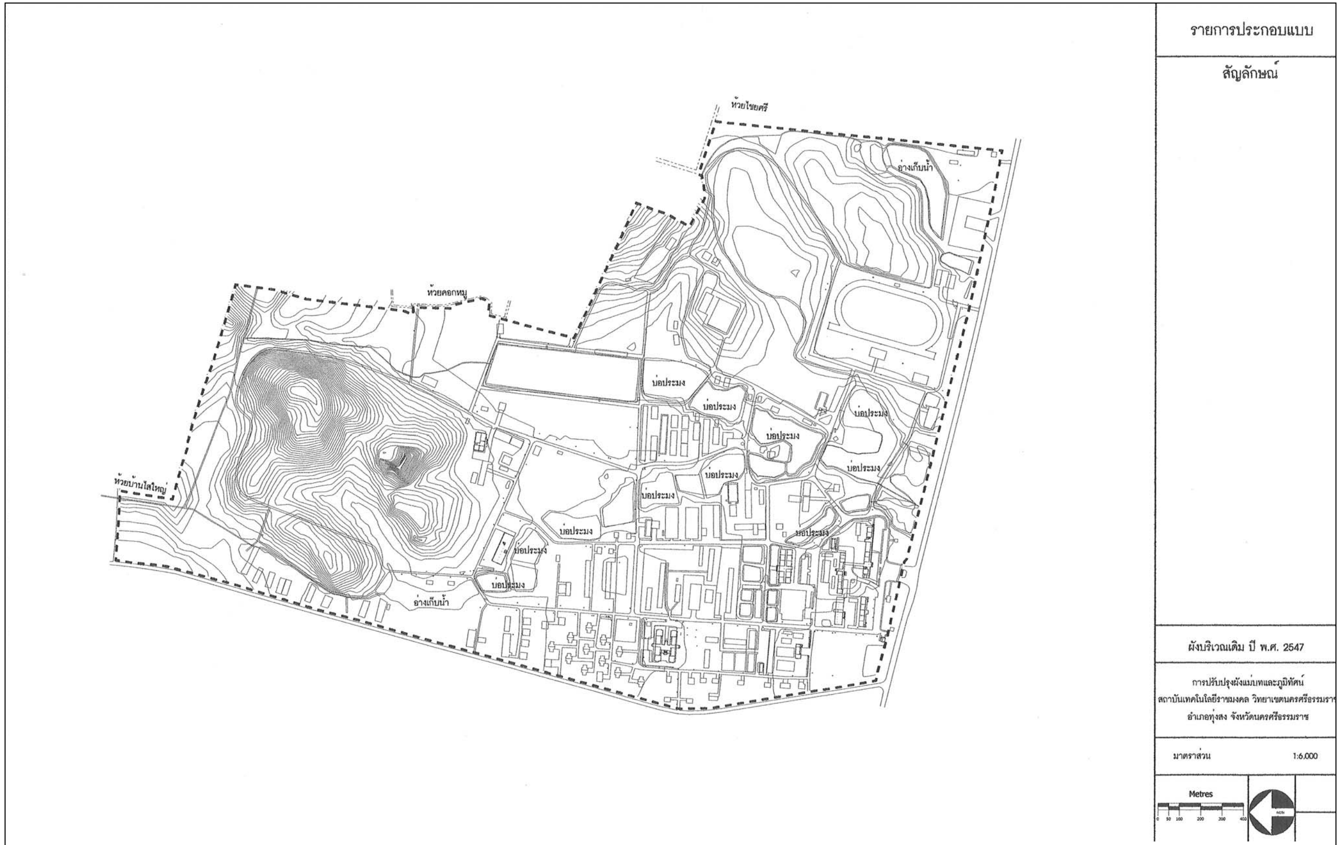
ภาพที่ 11 ผังบริเวณเดิม ปี พ.ศ. 2547