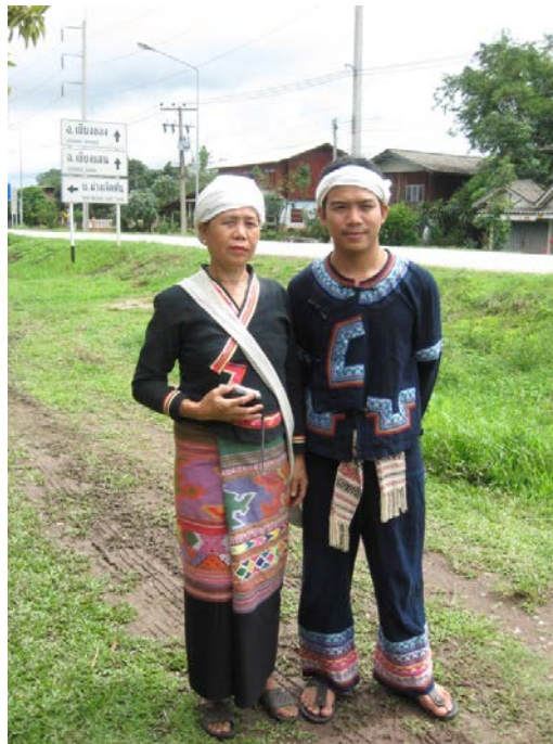
ภาพที่ 4 ภาพลักษณะการแต่งกายของกลุ่มชาติพันธุ์ไทลื้อ บ้านศรีดอนชัย อำเภอเชียงของ จังหวัดเชียงราย

อำเภอเชียงของประกอบด้วยคนหลายเชื้อชาติ เช่น ชาวไทยพื้นเมืองเดิม ไทยลื้อ จีนฮ่อ และชาวไทยภูเขาเผ่าต่าง ๆ เช่น ม้ง (แม้ว) เข่า ลาหู่ (มูเซอ) ขมุ ดังนั้นจึงส่งผลต่อศิลปวัฒนธรรมที่มีความหลากหลายตามวิถีของชุมชนที่มีอยู่หลายเชื้อชาติ และจากอดีตที่เชียงของเคยเป็นเมืองโบราณที่มีประวัติศาสตร์มายาวนาน เคยรุ่งเรือง มาตั้งแต่สมัยกรุงศรีอยุธยา (เชียงแสน) จึงทำให้มีต้นแบบศิลปวัฒนธรรมที่ทรงคุณค่าและคงอยู่ให้ลูกหลานได้ชื่นชมและอนุรักษ์ไว้ในปัจจุบัน เช่นการแต่งกาย