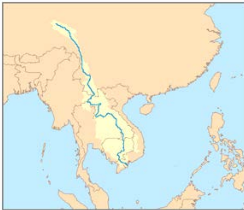
ภาพที่ 1 แผนที่แสดงอาณาบริเวณลุ่มน้ำโขง

แม่น้ำโขง มีต้นกำเนิดจากเทือกเขาหิมาลัย ไหลผ่านมณฑลชิงไห่ ประเทศจีน และบริเวณที่ราบสูงทิเบต ไหลลงสู่ทะเลจีนใต้ ผ่านประเทศจีน ประเทศลาว ประเทศพม่า ประเทศไทย ประเทศกัมพูชา