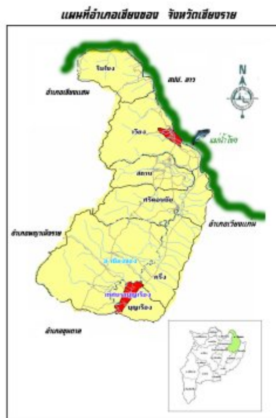
ภาพที่ 3 แผนที่แสดงที่ตั้งอำเภอเชียงของ (อ้างถึงใน http://www.chiangkhongfestival.l )