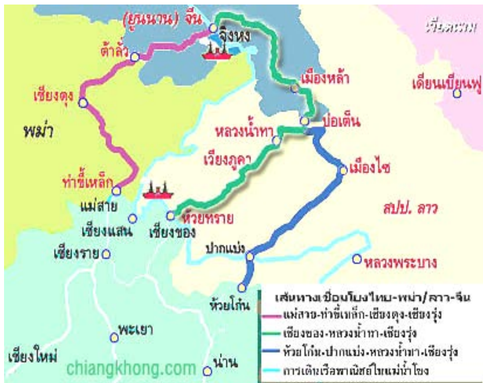
แผนภาพที่ 2 แสดงแผนที่อำเภอเชียงแสน(อ้างถึงใน http://www.chiangkhongfestival.com .)

" ถิ่นอมตะ พระเชียงแสน แดนสามเหลี่ยม เยี่ยมน้ำโขง จรโลงศิลปะ" นี้เป็นคำขวัญของอำเภอเชียงแสน ซึ่งเป็นอำเภอหนึ่งในจังหวัดเชียงราย และถือเป็นอำเภอที่มีประวัติศาสตร์อันยาวนาน และต้นกำเนิดของศิลปวัฒนธรรม โดยอำเภอเชียงแสนมีประวัติศาสตร์ความเป็นมาดังนี้