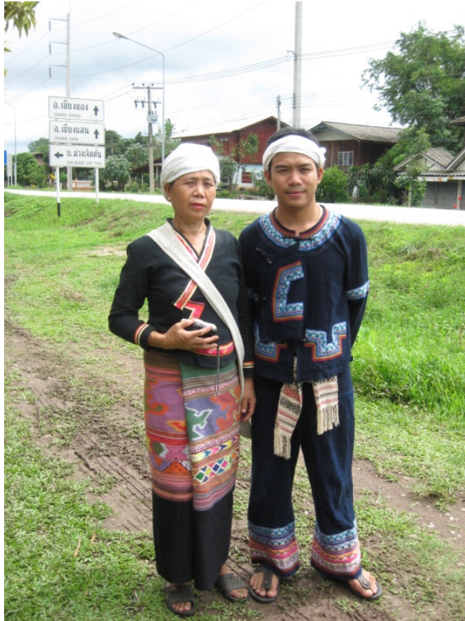
ภาพประกอบแสดง ลักษณะการแต่งกายของกลุ่มชาติพันธุ์ไทลื้อ บ้านศรี