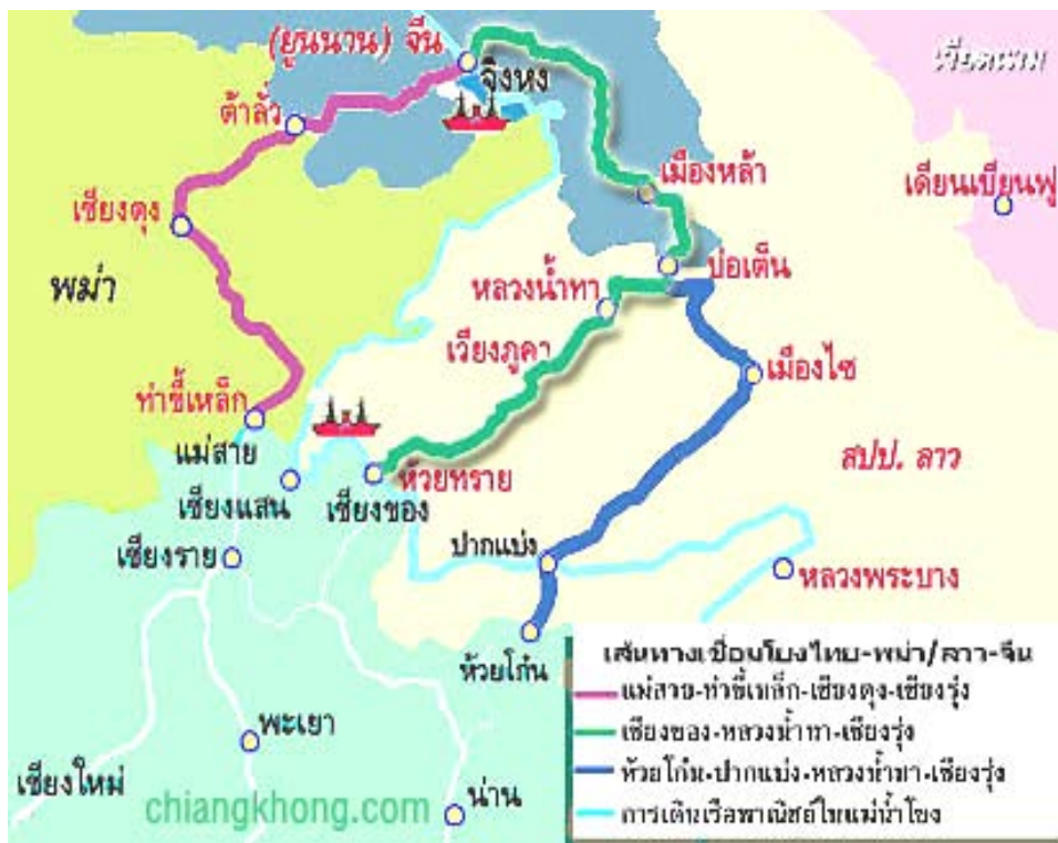
แผนภาพที่ แสดงแผนที่อำเภอเชียงแสน(.....)

" ถิ่นอมตะ พระเชียงแสน แดนสามเหลี่ยม เยี่ยมน้ำโขง จรรโลงศิลปะ" นี้เป็นคำขวัญของอำเภอ เชียงแสน ซึ่งเป็นอำเภอหนึ่งในจังหวัดเชียงราย และถือเป็นอำเภอที่มีประวัติศาสตร์อันยาวนาน และต้น กำเนิดของศิลปวัฒนธรรม โดยอำเภอเชียงแสนมีประวัติศาสตร์ความเป็นมาดังนี้