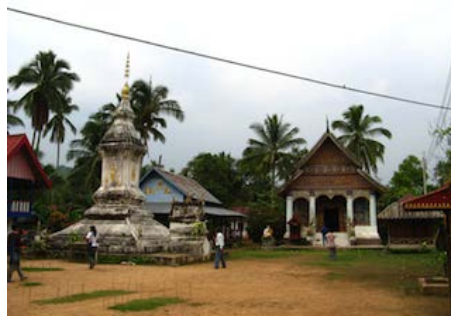
ภาพที่ วัดโพนไชยารามเมืองต้นผึ้ง แขวงบ่อแก้ว