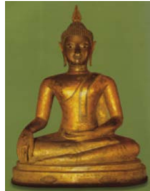
วัดผ้าขาวป่าน อ.เชียงแสน จ.เชียงราย และพระทันใจซึ่งเป็นพระประธานในวัด

ตามหลักฐานทางประวัติศาสตร์ในอดีตพื้นที่อำเภอเชียงแสน จังหวัดเชียงราย นั้นถือเป็นอำเภอที่เป็นเมืองเก่า และเป็นต้นกำเนิดของศิลปวัฒนธรรมมากมาย เนื่องจากในอดีตเมืองเชียงแสนในสมัยล้านนาตอนต้นเป็นเมืองศูนย์กลางของอาณาจักรและพระศาสนา และยังถือเป็นเมืองที่เป็นต้นกำเนิดของพระพุทธรูปเชียงแสน ซึ่งเป็นพระพุทธรูปที่มีลักษณะงดงามน่าเกรงขามมาก ซึ่งจากการศึกษาข้อมูลจากการเก็บรวบรวมข้อมูลในพื้นที่ พบว่าประวัติความเป็นมาของพุทธปฏิมาในพื้นที่อำเภอเชียงแสนตั้งแต่อดีตจนถึงปัจจุบันนั้นพบว่าการสร้างพุทธปฏิมาในพื้นที่อำเภอเชียงแสนนั้นสร้างขึ้นเพื่อเป็นรูปเคารพที่เป็นตัวแทนของพระพุทธเจ้าให้พุทธศาสนิกชนได้กราบไหว้เคารพบูชา ซึ่งพุทธปฏิมาองค์แรกที่สร้างขึ้นในเขตพื้นที่อำเภอเชียงแสนนั้นไม่มีประวัติหรือข้อมูลที่แน่ชัด แต่มีหลักฐานทางประวัติศาสตร์และข้อมูลที่ตรงกัน