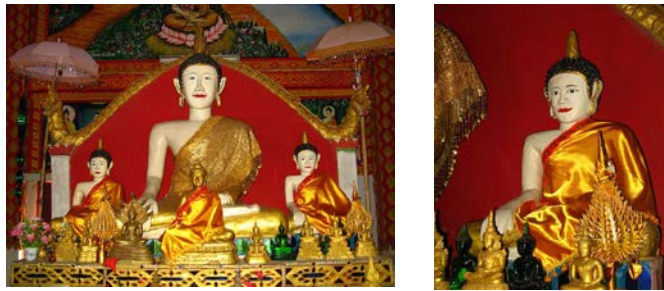
ภาพที่ พระประธานในสิมวัดสีดอนคาน บ้านน้ำเมืองใน เมืองต้นฝิ่ง แขวงบ่อแก้ว