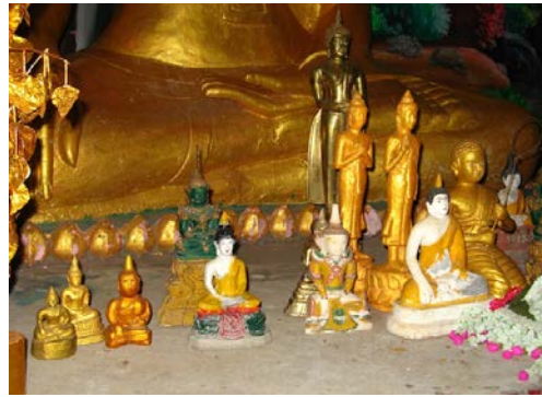
ภาพที่ พระประธาน และพระไม้ที่พบที่วัดแก้ว โพนสวนวันทาราม