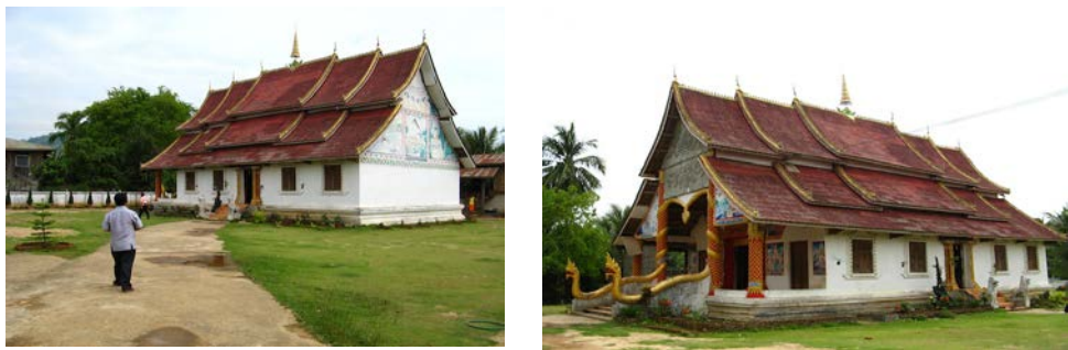
ภาพที่ สิมในวัดสีดอนไซ เมืองต้นฝิ่ง แขวงบ่อแก้ว