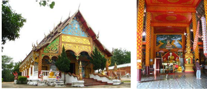
ภาพที่ วัดสีดอนคาน บ้านน้ำเมืองใน เมืองต้นฝิ่ง แขวงบ่อแก้ว