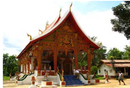
ภาพที่ วัดแก้วโพนสวนวันทาราม เมืองต้นผึ้ง แขวงบ่อแก้ว