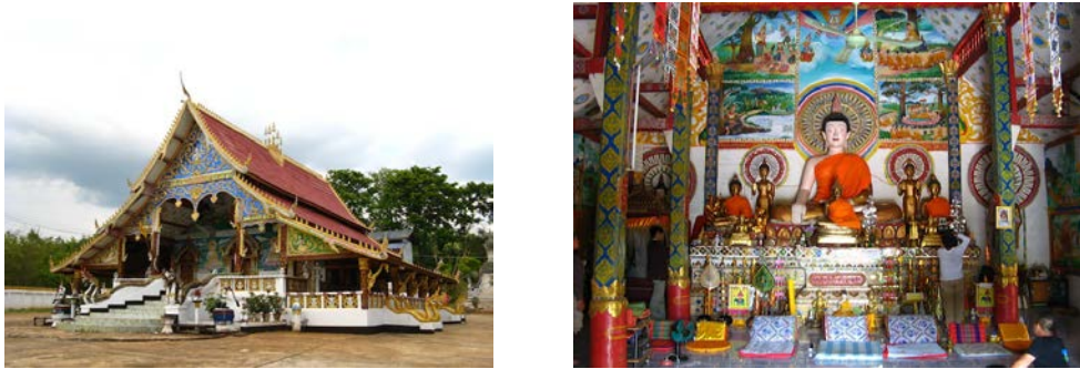
ภาพที่ สิม และพระประธานวัดทาดสุวรรณะผาคำ เมืองต้นผึ้ง แขวงบ่อแก้ว

ศิลปกรรมหลายอย่างในแขวงบ่อแก้วซึ่งรวมทั้งพระพุทธรูปปฏิมา มีการสร้างสรรค์ที่เริ่มมีลักษณะแบบของตนเอง ในขณะที่เดียวกันรูปแบบของพระพุทธรูปเหล่านั้นยังคงอัตลักษณ์บางอย่างที่สามารถสะท้อนความเชื่อมโยงด้านศิลปกรรมอันเป็นวัฒนธรรมร่วมของผู้คนในภูมิภาคแถบนี้ จากการลงพื้นที่ศึกษาวัดหลายแห่งในแขวงบ่อแก้ว เมืองต้นผึ้ง พบว่าพระพุทธรูปที่เป็นพระประธานในสิมมีรูปแบบที่หลากหลาย แต่ในความหลากหลายเหล่านั้นสามารถสะท้อนอัตลักษณ์ของศิลปกรรมลุ่มน้ำโขง ที่เกิดจากการผสมผสานรูปแบบศิลปะตามลักษณะของสกุลช่างแห่งอาณาจักรเชียงแสน สุโขทัย รวมทั้งล้านนา และล้านช้าง จนเกิดเป็นลักษณะเฉพาะในท้องถิ่น ดังตัวอย่างจากภาพถ่ายเหล่านี้