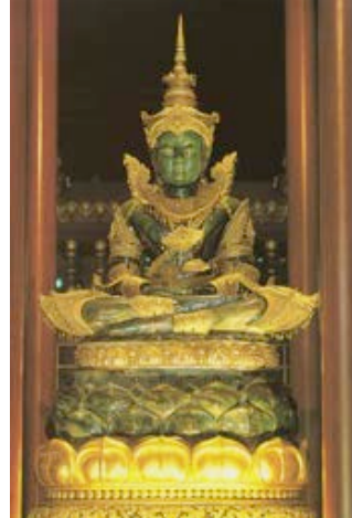
วัดพระแก้ว อ.เมือง จ.เชียงราย และพระแก้วซึ่งเป็นพระประธานในวัด