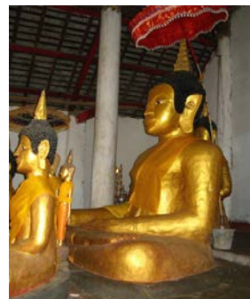
ภาพที่ พระประธาน และพระพุทธรูปอื่นๆ ในวัดสีดอนไซ เมืองต้นผึ้ง แขวงบ่อแก้ว ภาพที่ สิมในสิมวัดหงสาวะดี เมืองต้นผึ้ง แขวงบ่อแก้ว