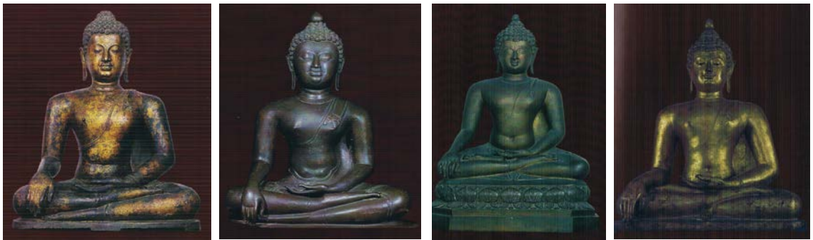
ภาพจากหนังสือพระพุทธรูปและเทวรูป : ศิลปะล้านนา สุโขทัย อโยธยา และรัตนโกสินทร์

รูปแบบพระพุทธรูปสมัยล้านนา หรือเชียงแสนมีลักษณะที่เป็นเอกลักษณ์ คือ พระพุทธรูปแบบเชียงแสนรุ่นแรกจะมีพระวรกายอวบอ้วน มักประทับนั่งในท่าขัดสมาธิเพชร(สมาธิขัด)เหนือปัทมาสน์หรือฐานรูปบัวคว่ำ-บัวหงาย สร้างขึ้นราวพุทธศตวรรษที่ 19 สมัยต่อมาก็ยังพบการสร้างพระพุทธรูปที่มีลักษณะอันเป็นเอกลักษณ์ขึ้นมาอีก นักวิชาการเรียกพระพุทธรูปกลุ่มนี้ว่า "พระพุทธรูปแบบเชียงแสนรุ่น 2" หรือ "แบบเชียงแสนสอง" รูปแบบมีการพัฒนาโดยรับเอามาจากศิลปะสุโขทัย คือ พระวรกายเพรียวเล็กกลง เค้าพระพักตร์เป็นรูปไข่ พระรัศมีรูปเปลว และชายจีวรยาวลงมาจรดพระนาภี ต่อมาในช่วงพุทธศตวรรษที่ 20 จึงเริ่มมีการสร้างพระพุทธรูปแบบทรงเครื่อง และมักให้ความสำคัญกับการตกแต่งตรงส่วนฐานที่มีลวดลายซับซ้อนและยกสูงชัน ลักษณะมากมายหลากหลายของพระพุทธรูปสมัยล้านนาเริ่มเด่นชัดขึ้นตั้งแต่ราวพุทธศตวรรษที่ 21 ที่ปรากฏอิทธิพลของศิลปะแบบสุโขทัยและศิลปะแบบพม่ารุ่นหลัง โดยเฉพาะรูปแบบศิลปะของสุโขทัยที่ยังสืบเนื่องความนิยม อีกทั้งความสัมพันธ์ระหว่างอาณาจักรล้านนากับอาณาจักรล้านช้าง ด้วยเหตุดังกล่าวทำให้ รูปแบบพระพุทธรูปสมัยล้านนามีความหลากหลาย แต่ในความหลากหลายนั้นยังสามารถสะท้อนเอกลักษณ์เฉพาะของตนได้เป็นอย่างดี