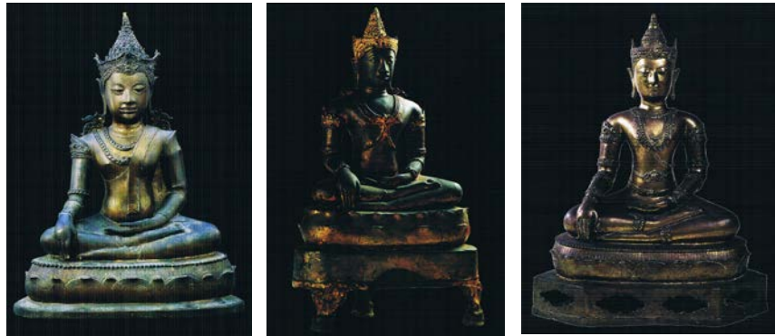
ภาพจากหนังสือพระพุทธรูปและเทวรูป : ศิลปะล้านนา สุโขทัย อยุรยา และรัตนโกสินทร์ พระพุทธรูปปฏิมาแบบทรงเครื่อง เขี้ยวแสนสาม

จากการสำรวจพบว่าพระพุทธรูป หรือพระประธานในโบสถ์ รวมทั้งพระพุทธรูปสำคัญที่มีความโดดเด่นในพื้นที่วิจัยนั้น พบว่ามีรูปแบบหลากหลาย แต่ในรูปแบบที่หลากหลายนั้นยังมีพุทธลักษณะบางอย่างที่กล่าวได้ว่าเป็นลักษณะร่วมของพระพุทธรูปปฏิมาลุ่มน้ำโจง ได้แก่ ปางของพระพุทธรูปซึ่งส่วนใหญ่ชาวบ้านนิยมพระพุทธรูปปางมารวิชัย มีส่วนน้อยที่เป็นปางอื่นๆ เช่น ปางสมาธิ ปางประธานพร ปางประทับยืนในอริยบทต่าง ๆ