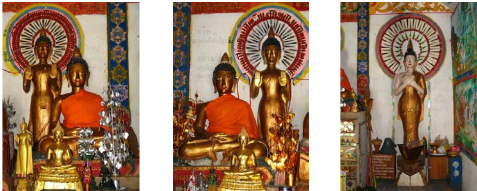
ภาพที่ พระพุทธรูปปางต่างๆ ในวัดทาดสุวรรณะผาคำ เมืองต้นผึ้ง แขวงบ่อแก้ว