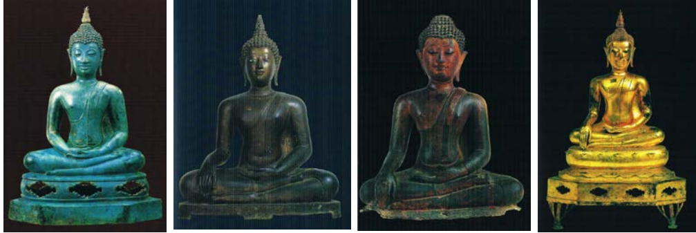
ภาพจากหนังสือพระพุทธรูปและเทวรูป : ศิลปะล้านนา สุโขทัย อยุรยา และรัตนโกสินทร์ พระพุทธรูปปฏิมาแบบเขี้ยวแสนสอง พระวรกายเพรียวเล็กกลอง เค้าพระพักตร์เป็นรูปไข่ พระรัศมีรูปเปลว และชายจีวรยาวลงมาจรดพระนาภี