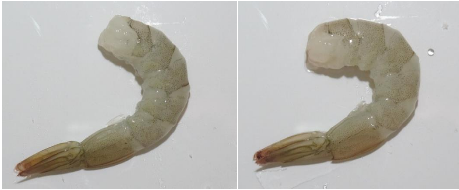
ภาพที่ 4.21 แสดงตัวอย่างของภาพที่มีเปลือกติด