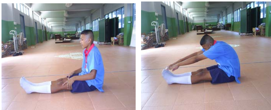
ภาพผนวกที่ 16 ภาพแสดง นั่งก้มแตะปลายเท้า

เสริมสร้าง ความอ่อนตัวกล้ามเนื้อต้นขาด้านหลัง และหลังส่วนกลาง