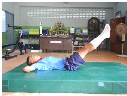
ภาพผนวกที่ 13 ภาพแสดง นอนหงาย มือประสานท้ายทอย ยกขาขึ้น – ลง