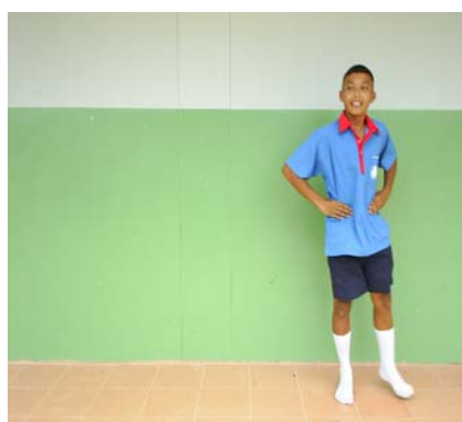
ภาพผนวกที่ 14 ภาพแสดง สไลด์เท้าคู่ไปทางซ้าย ขวา (10 เมตร)