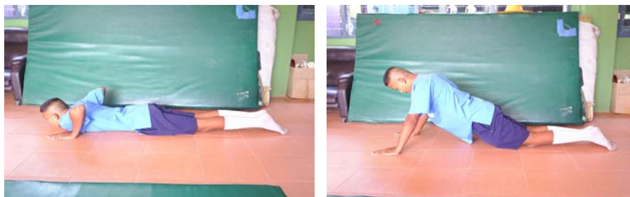
ภาพผนวกที่ 15 ภาพแสดง ลูกเข่าดันพื้น

เสริมสร้าง ความแข็งแรงกล้ามเนื้อไหล่ กล้ามเนื้อแขน และกล้ามเนื้ออก