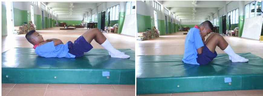
ภาพผนวกที่ 18 ภาพแสดง ลูก – นั่งไขว่เขน