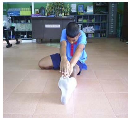
ภาพผนวกที่ 19 ภาพแสดง นั่งพับเข่าท่ากระโดดข้ามรั้ว ก้มแตะปลายเท้า