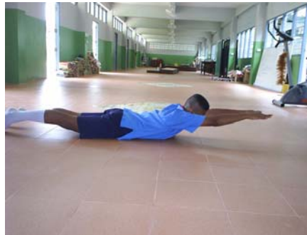
ภาพผนวกที่ 20 ภาพแสดง นอนคว่ำ ยกศีรษะ