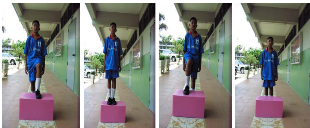
ภาพผนวกที่ 17 ภาพแสดง ก้าวขึ้นม้านั่ง

เสริมสร้าง ความอดทนของระบบไหลเวียนโลหิต และการหายใจ