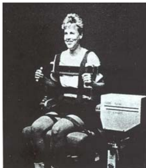
ภาพผนวกที่ 3 การทดสอบความแข็งแรงของกล้ามเนื้อหลังด้วยเครื่องไอโซไคเนติก ไดนาโมมิเตอร์ ยี่ห้อ Lido multi joint II