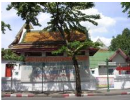
ภาพวัดมหารณพาราม B1