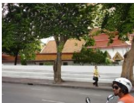
วัดชนะสงคราม F2

( ) เส้น ( ) สี ( ) รูปร่าง/รูปทรง ( ) พื้นผิว ( ) ขนาด/สัดส่วน ( ) แสง-เงา