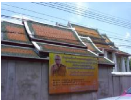
วัดเทพธิดาราม D1

34 กรุณาพิจารณาภาพ D1 และ D2 ภาพวัดเทพธิดาราม ซึ่งเป็นพระอารามหลวง ชั้นตรี ชนิด วรวิหาร นิกาย มหานิกาย แล้วโปรดระบุความรู้สึกของท่าน