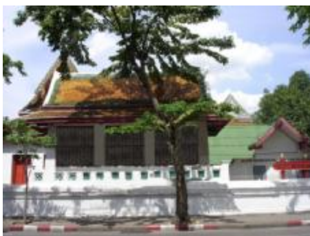
ภาพวัดมหารณพาราม B2