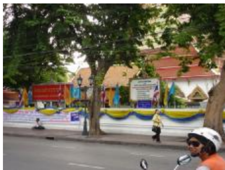
วัดชนะสงคราม F1

36) กรุณาพิจารณาภาพ F1 และ F2 ภาพวัดชนะสงคราม ซึ่งเป็นพระอารามหลวง ชั้นโท ชนิดราชวรมหาวิหาร นิกายมหานิกาย แล้วโปรดระบุความรู้สึกของท่าน