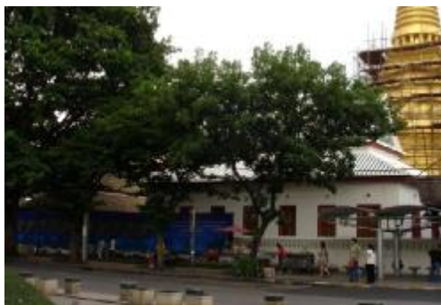
วัดบวรนิเวศ E1

35) กรุณาพิจารณาภาพ E1 และ E2 ภาพวัดบวรนิเวศวิหาร ซึ่งเป็นพระอารามหลวง ชั้น เอกชนิต ราชวรมหาวิหาร นิกายธรรมยุต แล้วโปรดระบุความรู้สึกของท่าน