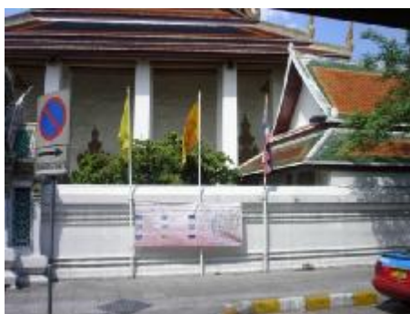
วัดพระเชตุพนวิมลมังคลาราม C1

33) กรุณาพิจารณาภาพ C1 และ C2 ภาพวัดพระเชตุพนวิมลมังคลาราม ซึ่งเป็นพระอารามหลวง ชั้น เอก ชนิดราชวรมหาวิหาร นิกาย มหานิกาย แล้วโปรดระบุความรู้สึกของท่าน