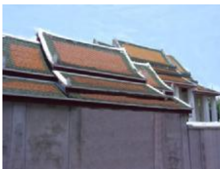
วัดเทพธิดาราม D2