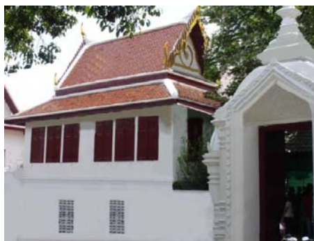
ภาพวัดสุทัศน์ A2

5. จากภาพ A2 ท่านมองภาพวัดแล้วรู้สึกอย่างไร