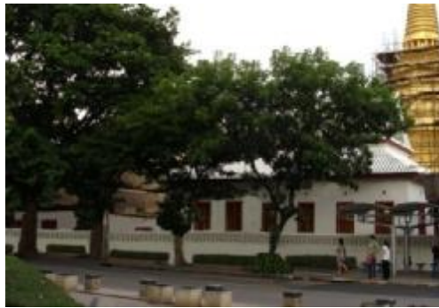
วัดวรนิเวศ E2