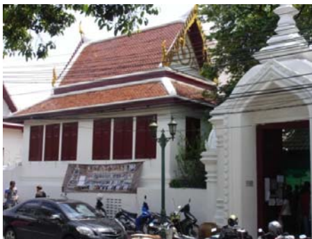
ภาพวัดสุทัศน์ A1