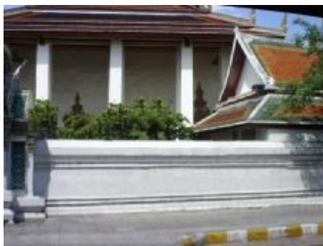
วัดพระเชตุพนวิมลมังคลาราม C2

5 จากภาพจากภาพ C2 ท่านมองภาพวัดแล้วท่านรู้สึกอย่างไร