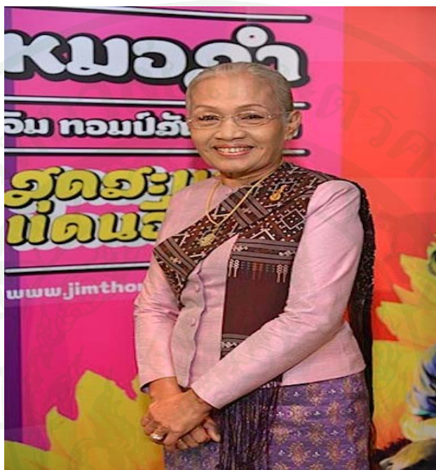
ภาพผนวกที่ 1 นางฉวีวรรณ ดำเนิน ศิลปินแห่งชาติพ.ศ. 2536 สาขาศิลปะการแสดง (หมอลำ)

ดร.ฉวีวรรณ ดำเนิน เกิดเมื่อวันที่ 16 พฤษภาคม พ.ศ. 2488 ปัจจุบันอายุ 68 ปี เป็นคนจังหวัดอุบลราชธานี เป็นบุตรของ นายชาติ ดำเนิน และ นางแก้ว ดำเนิน อาชีพทำนา ท่านมีความสามารถด้านการร้องหมอลำ ทั้งด้านการแต่ง กลอนลำ การคิดท่วงทำนองหมอลำกลอน เขียนกลอนลำ ประดิษฐ์ทำรำและบทร้องชุดแม่อีสาน ผลงานที่โดดเด่นที่สุด คือ การแสดงชุดดั่งครดั่งสาก ทำให้ได้รับการยกย่องว่าเป็นเพชรน้ำหนึ่งของแดนอีสานและได้รับการกล่าวขานด้วยความชื่นชมจากประชาชน ว่าเป็นราชินีหมอลำ ซึ่งเป็นราชินีหมอลำคนแรกแห่งประเทศไทย