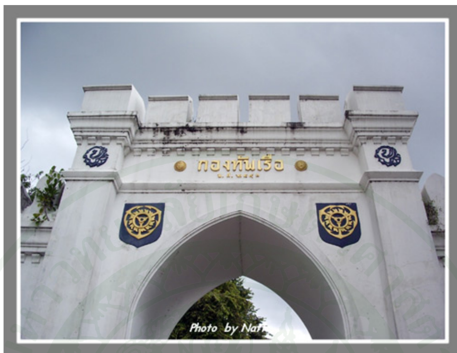
ภาพผนวกที่ 7 พระราชวังเดิมที่ฝั่งธนบุรี ปัจจุบันคือที่ตั้งของกองทัพเรือ ที่เจ้าหญิงปรางจาก นครศรีธรรมราชเข้าถวายตัวเป็นเจ้าจอม