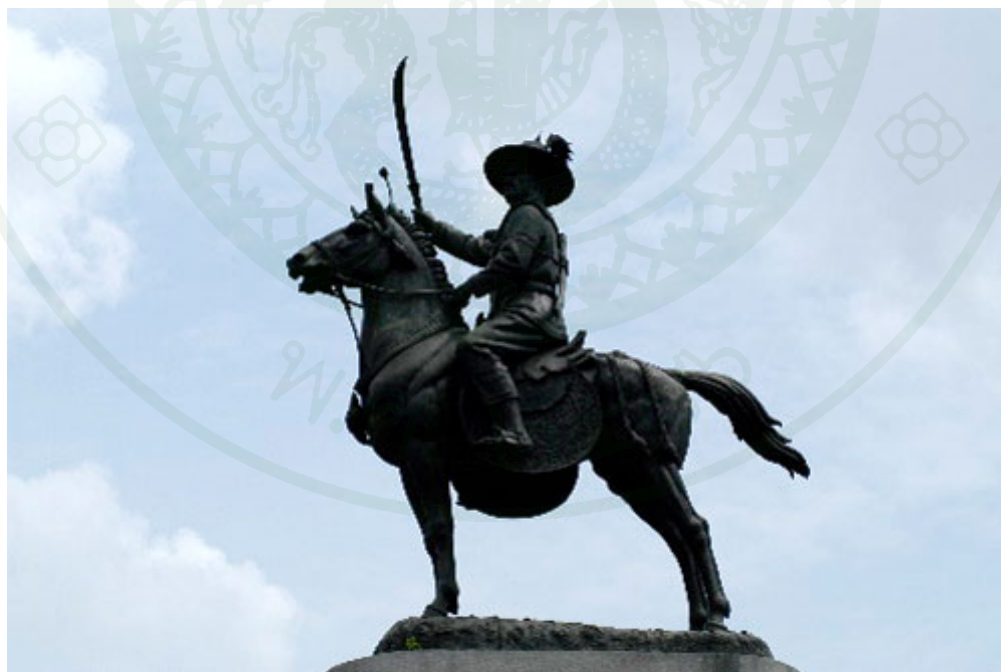
ภาพผนวกที่ 6 พระบรมรูปสมเด็จพระเจ้าตากสินมหาราช ณ วงเวียนใหญ่ ฝั่งธนบุรี กรุงเทพมหานคร