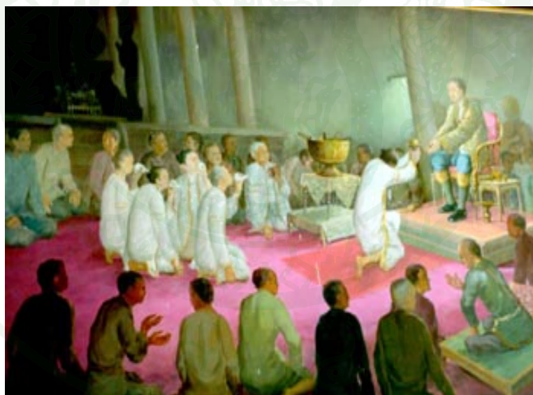
ภาพผนวกที่ 3 ภาพวาดกลุ่มพราหมณ์เข้าพบเจ้าพระยานคร (น้อย)