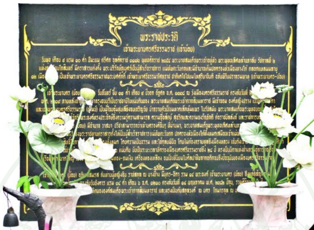
ภาพผนวกที่ 5 คำจารึกประวัติได้ฐานอนุสาวรีย์เจ้าพระยานคร (น้อย)