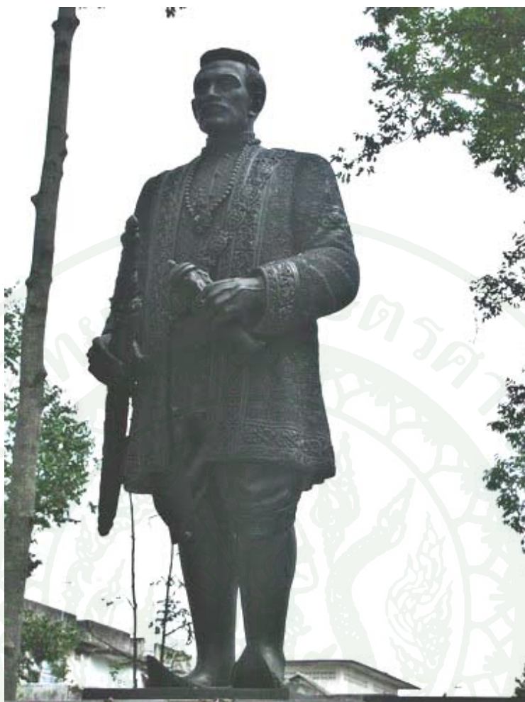
ภาพผนวกที่ 4 อนุสาวรีย์เจ้าพระยานคร (น้อย) จังหวัดนครศรีธรรมราช วันที่ 27 สิงหาคม พ.ศ. 2555