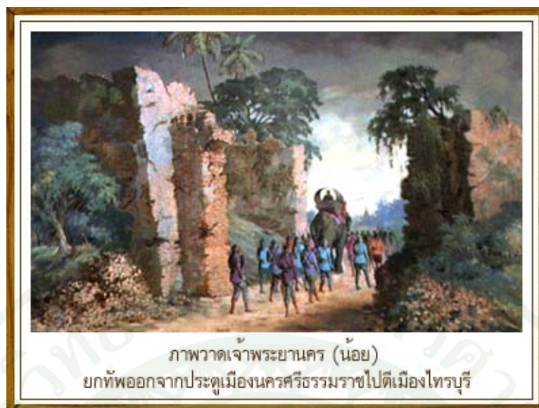
ภาพผนวกที่ 2 ภาพวาดเจ้าพระยานคร (น้อย) ยกทัพออกจากประตูเมืองนครศรีธรรมราชไปตีเมืองไทรบุรี