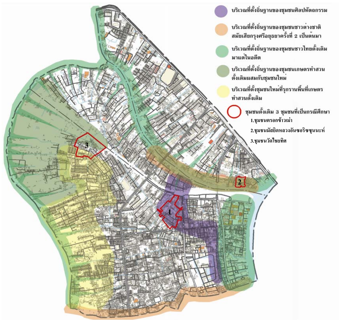
ภาพที่ 4.1 แผนที่แสดงที่ตั้งลักษณะชุมชนและขอบเขตของชุมชนดั้งเดิมที่เลือกศึกษา 3 ชุมชน ในเขตบางกอกน้อย

จากการศึกษาข้างต้น ทำให้ทราบถึงลักษณะของชุมชนดั้งเดิมในเขตบางกอกน้อย ดังรูปภาพที่ 4.1