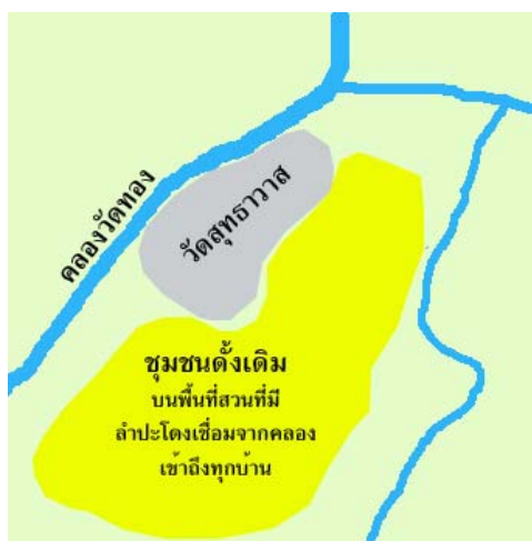
ภาพที่ 4.3 แสดงการเกิดชุมชนดั้งเดิมของชุมชนตรอกข้าวเม่า

ชุมชนตรอกข้าวเม่าเป็นชุมชนเก่าแก่ที่อพยพมาจากกรุงศรีอยุธยา สมัยกรุงธนบุรีเป็นราชธานี เดิมพื้นที่นี้เป็นหมู่บ้านชาวสวน มีผลไม้ต่าง ๆ มากมาย อาทิเช่น มังคุด ละมุด มะม่วงทุเรียน มีคลองลัดวัดทองผ่านพื้นที่ น้ำท่าอุดมสมบูรณ์บ้านเกือบทุกหลังมีลำปะโดงไหลผ่านหน้าบ้าน ใช้การคมนาคมทางน้ำเป็นหลัก สามารถพายเรือไปออกคลองบางกอกน้อย คลองบางขุนศรี คลองบ้านขมิ้น และไปยังวัดยางสุทธาราม วัดคงมูลเหล็ก วัดอัมพวาได้ ดังนั้นการส่งผลไม้ไปขายยังตลาดท่าเตียนจึงอาศัยทางเรือ หรือไม่ก็หาบไปข้ามเรือที่ทำวังหลัง(อนุชา, ม.ป.ป.)