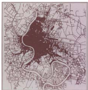
ปี พ.ศ.2496(สมัย รัชกาลปัจจุบัน)