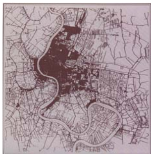
ปี พ.ศ.2479(สมัย รัชกาลที่ 8)