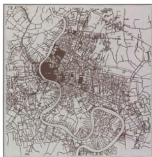
ปี พ.ศ.2443 (สมัย รัชกาลที่ 5)