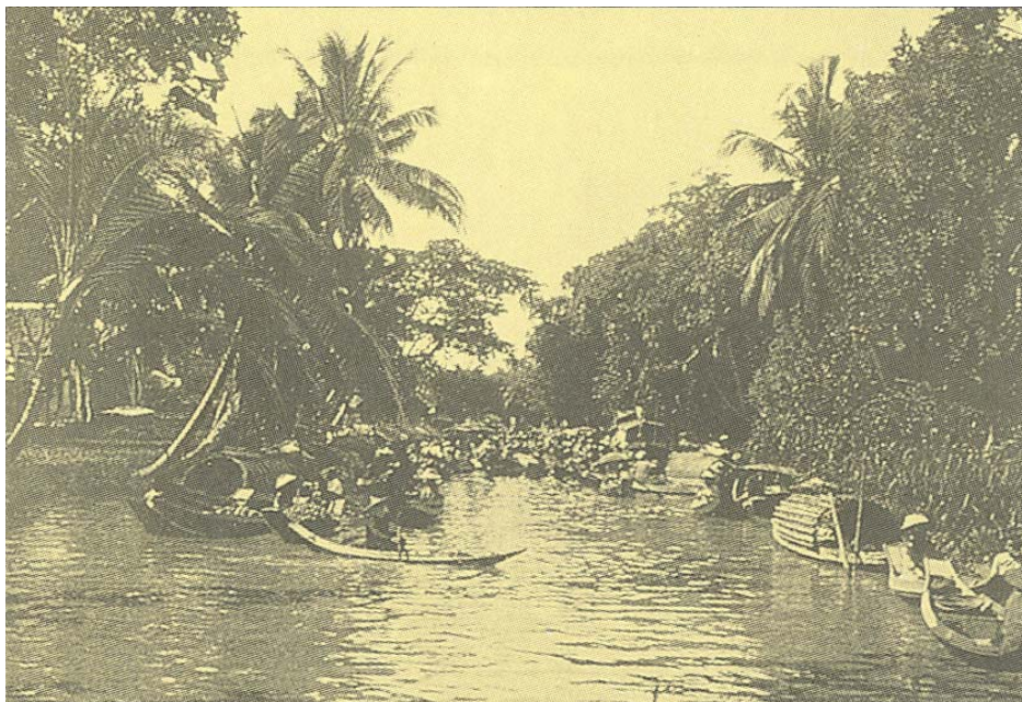
ภาพที่ 3.5 ตลาดน้ำบางกอกน้อย สมัยรัชกาลที่ 5

ของที่นิยมขายมีเครื่องสังฆภัณฑ์ ที่นอน ทุบเทียนแพฟุ่มดอกไม้ พวงอุบะ และหม้อดินเผาที่รับจากพวกมอญมาอีกต่อหนึ่ง(สุคารา, 2543: 47-48) รูปภาพ 3.5 และ 3.6