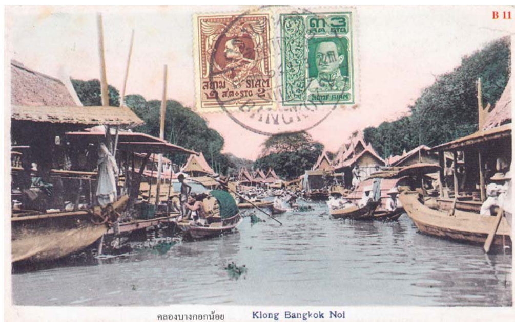
ภาพที่ 3.6 สภาพคลองบางกอกน้อย สมัยรัชกาลที่ 6 ที่มา: วิจิต(2547)