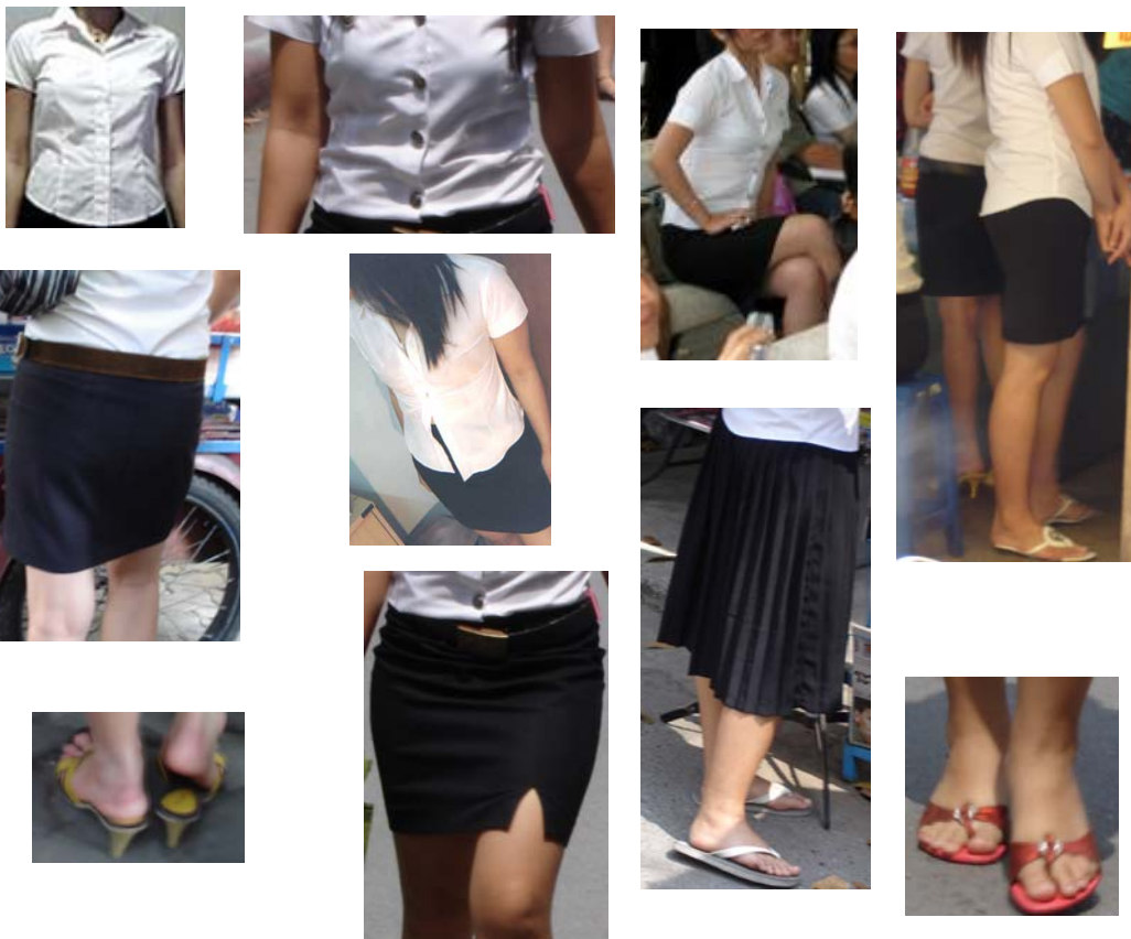
ลักษณะเครื่องแบบนิสิตที่เบี่ยงเบน พ.ศ.2548 - 2549