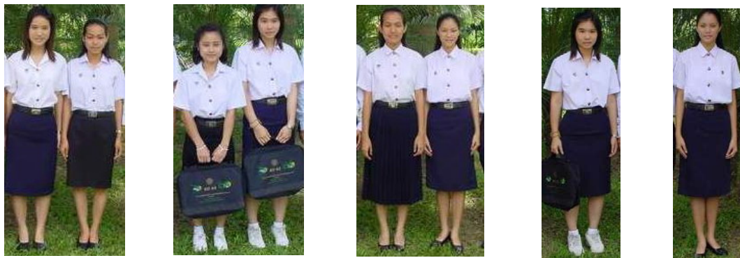
ลักษณะเครื่องแบบนิสิตที่ถูกต้อง