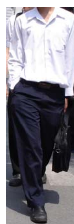
ลักษณะเครื่องแบบนิสิตที่ถูกต้อง