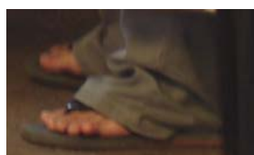
ลักษณะเครื่องแบบนิสิตที่เบี่ยงเบน พ.ศ.2548 – 2549

ระหว่างเดือนพฤศจิกายน 2548 ถึงเดือนมกราคม 2549 เวลา 10.00-13.00 บริเวณศูนย์เรียนรวม 2 และศูนย์เรียนรวม 3