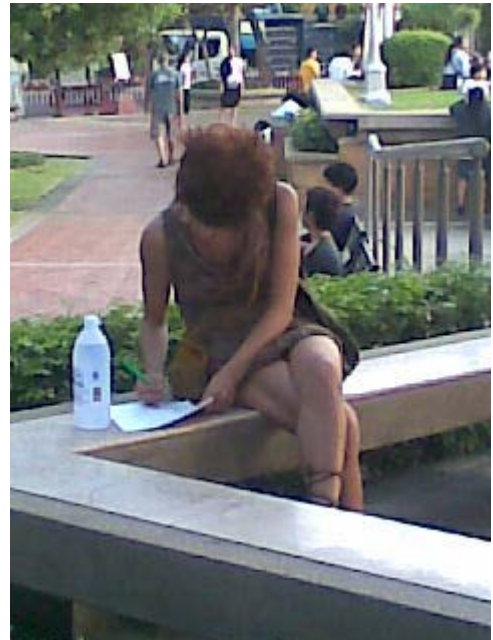
ภาพบางส่วนของ การเก็บรวบรวมข้อมูลจากนักท่องเที่ยวที่เคยไปทั้ง 2 แห่ง