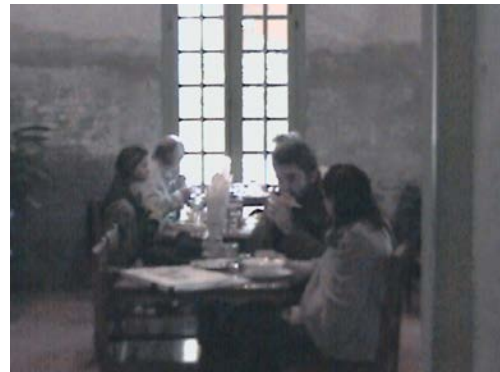
ภาพบางส่วนในการสัมภาษณ์ผู้ให้ข้อมูลสำคัญเมืองหลวงพระบาง