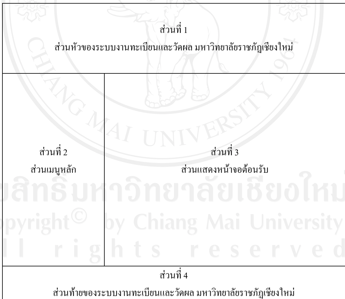
รูปที่ 5.1 แสดงการออกแบบหน้าจอต้อนรับเข้าสู่ระบบ