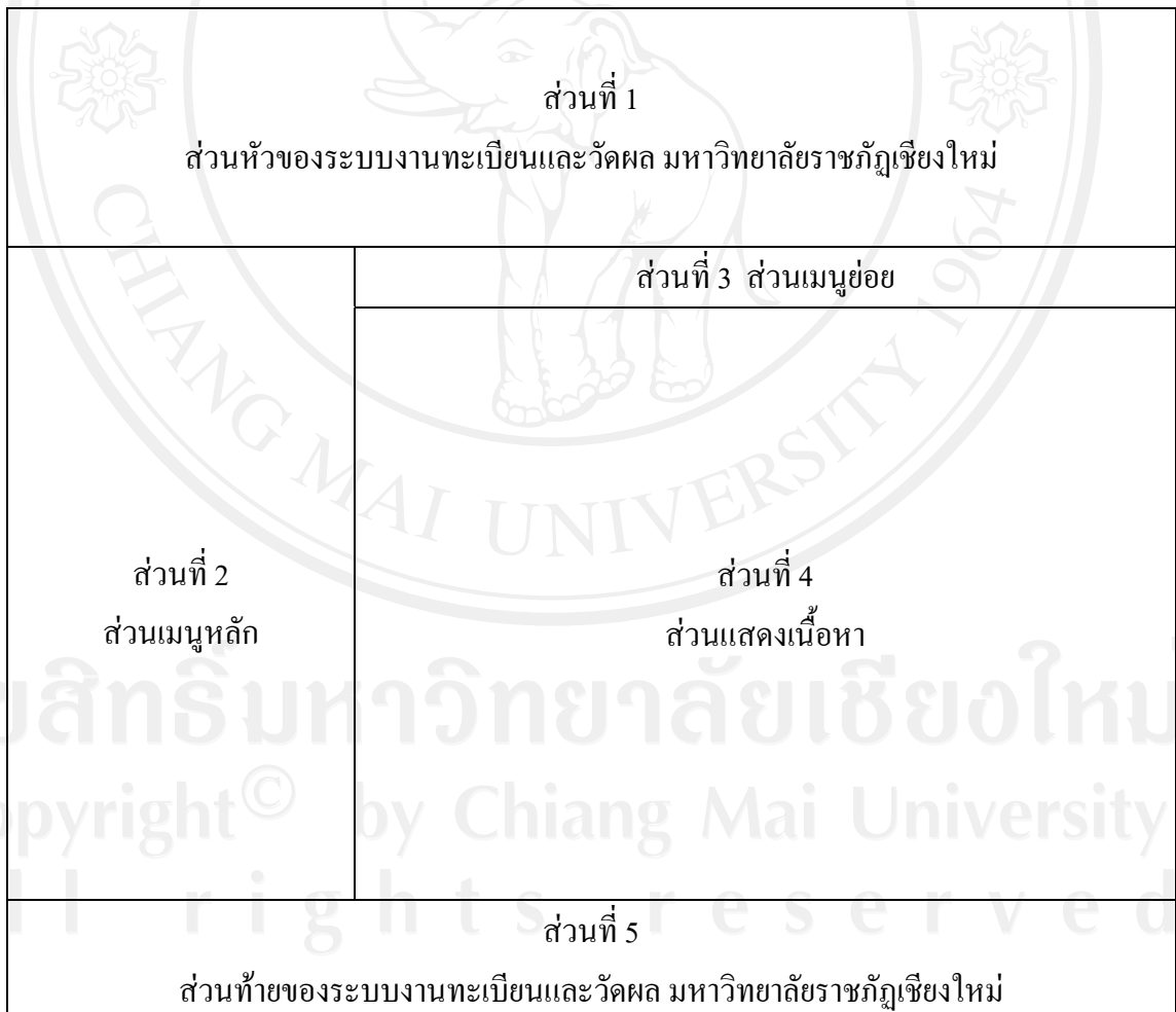
รูปที่ 5.2 แสดงการออกแบบจอภาพของงานทะเบียนนักศึกษา